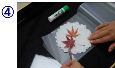
④ コースター台紙の上に乾燥した材料を好きなように置いて行く。色を付けてもOKです。