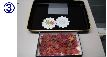
③ 材料が乾燥したら、作業開始できる。