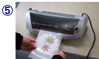
⑤ ラミネート加工する。