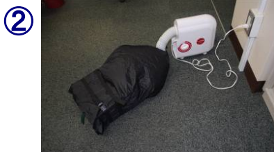
② 押し花乾燥機で材料を乾燥させる。（6時間乾燥）