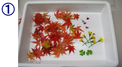
① 材料となる葉っぱや花びらを探して採取する。