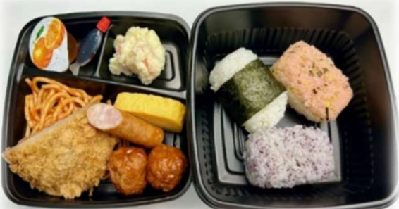
③二段おにぎり3個弁当 620円