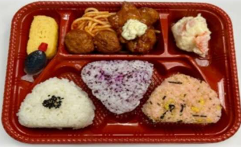
①おにぎり3個弁当 620円