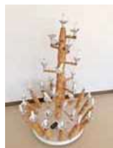
キャンドルのつどい用燭台（左から体育館用、ホール用、大研修室用）