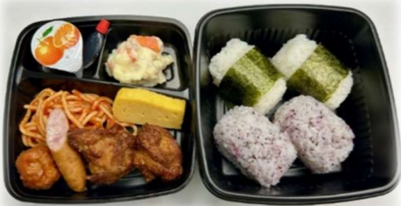
②二段おにぎり4個弁当 620円