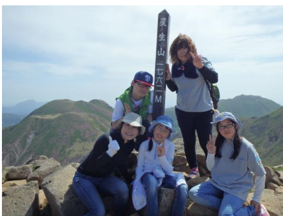
登頂した参加者の様子