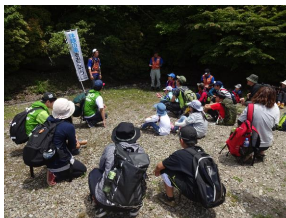
閉会式の振り返りの様子