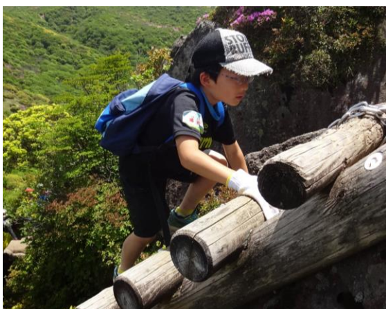
ルート上の難所を上る参加者