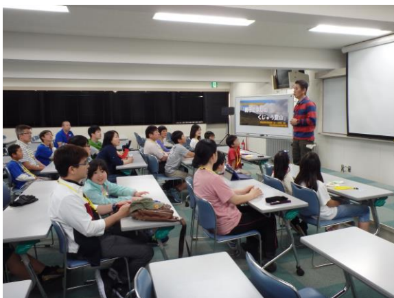
登山インフォメーション