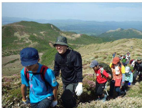
山頂を目指す参加者の様子