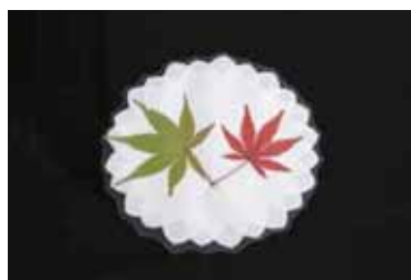
押し花コースター

※石灰は芝の養生に配慮した石灰のみ使用可能です。当施設の石灰は、卵の殻を原料としています。