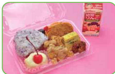
⑨幼児弁当 (おにぎり1個) 350円