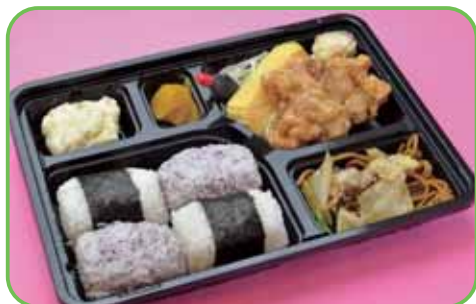
②弁当 (俵おにぎり4個) 520円