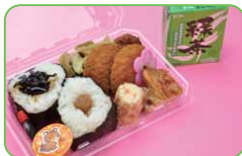
⑩夏茶弁当 (おにぎり2個) 520円

※弁当の内容は季節等によって異なることがありますのでご了承ください。 ※当日の朝食時から、レストランでお渡しが可能です。