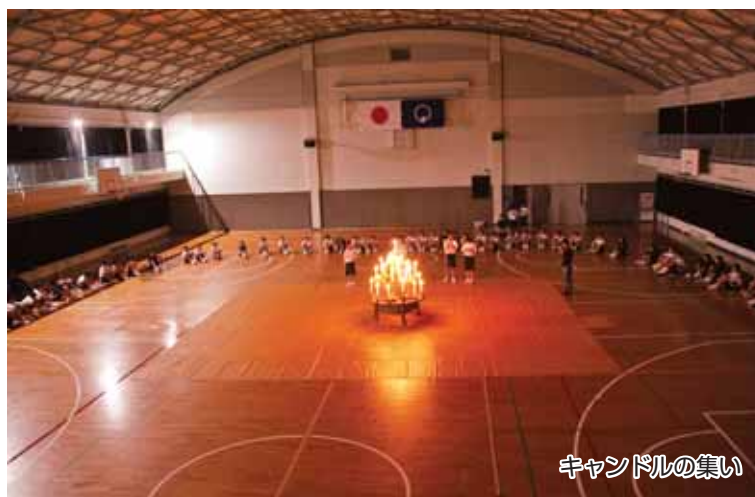
キャンドルの集い