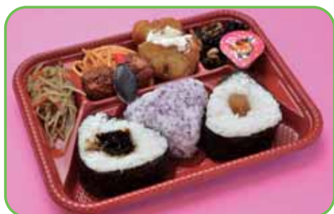
⑤夏弁当 (おにぎり3個) 520円