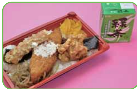
⑥茶弁当 (のり弁当) 520円