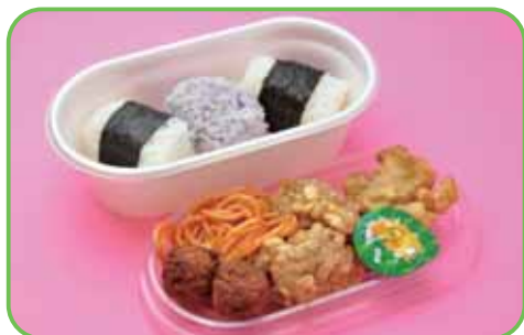
③二段弁当 (俵おにぎり) 520円