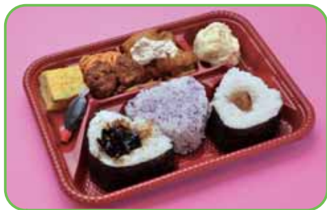
①弁当 (おにぎり3個) 520円