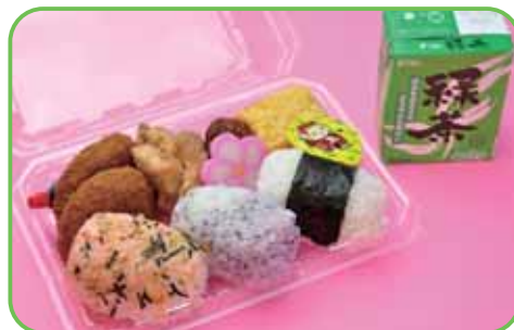
⑦茶弁当 (俵おにぎり3個) 520円