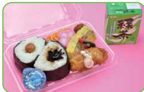
⑧茶弁当 (おにぎり2個) 520円